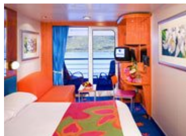
Cabine balcon $ 3399