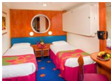
Cabine intérieure $ 3169

Hawaii (Big Island) Au sud de l'archipel, Hawaii ou la «Grande Ile» en est la plus vaste. Plus de 480 km de rivages, des plages de sable blanc ou de sable volcanique noir, des forêts tropicales luxuriantes, les montagnes les plus hautes d'Hawaii (le Mauna Kea, 4 205m, à la cime parfois enneigée et le Mauna Loa, 4.169m), ainsi que le Kilauea, dans le Parc National des Volcans d'Hawaii, au sud de l'île, le volcan le plus actif du monde. L'île compte plusieurs magnifiques chutes d'eaux, comme Rainbow Falls ou Akaka falls.