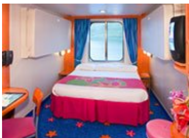
Cabine vue mer $ 3349